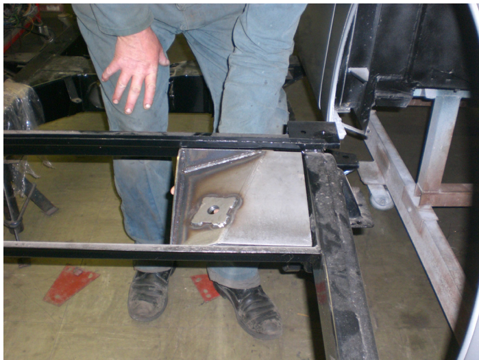
Abb. 1 / ill. 1

Bitte beachten sie: Schweißarbeiten sind erforderlich. Dieser Umbau sollte während einer „Frame off“ Restauration durchgeführt werden.