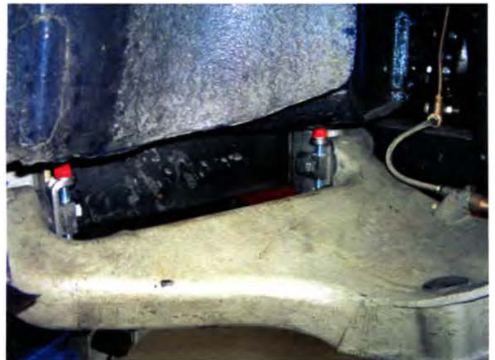
Abbildung 2 – linke Fahrzeugseite, bei unserer ersten Serie waren die Muttern leider silber lackiert, zeigen jedoch nach „oben“